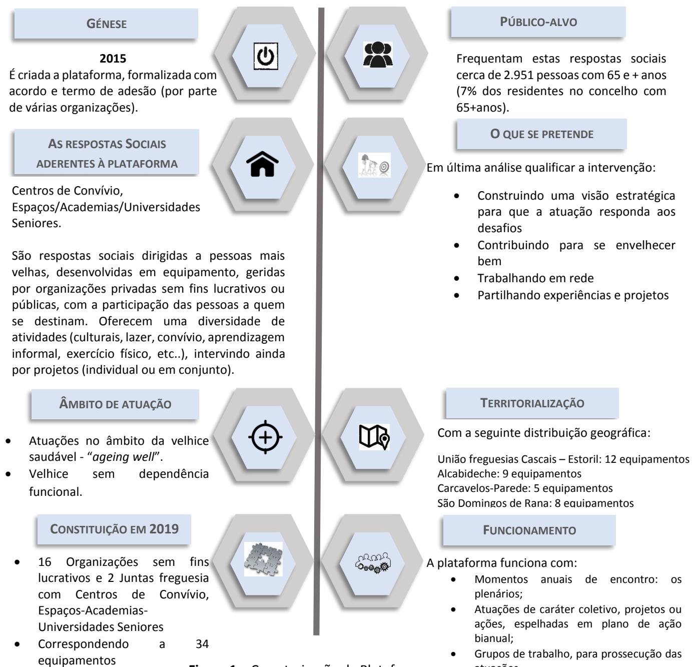
Figura 1 – Caracterização da Plataforma

A intervenção social em Cascais tem, sobretudo desde o início da década de 2000, se caracterizado pela proliferação de experiências de governança, com liderança municipal, que se traduzem na concertação da atuação, entre organizações públicas e privadas, com vista a um fim comum. Estas estruturas de parceria, designadas fóruns-plataformas, têm-se pautado pela metodologia de planeamento, como forma de promoção da melhoria contínua ou de mudança social-organizacional. De seguida apresentam-se alguns elementos de caracterização da Plataforma de Qualificação dos Centros de Convívio, Espaços-Academias-Universidades Seniores (Figura 1):