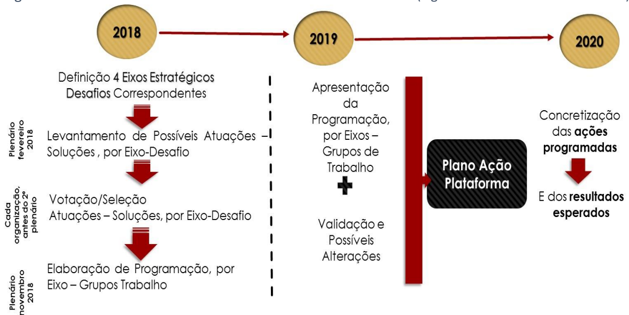
Figura 2 – Metodologia para elaboração do Plano de Ação

A metodologia para a elaboração do plano de ação 2019-2020, pode-se representar da seguinte forma (Figura 2):